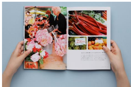
PHOTOPRESSO Grande(グランデ) 242×182mm [B5変形] 16ページ

PHOTOPRESSO(フォトプレッソ)の無料クーポンはおしゃれ雑誌のような「Grande(グランデ)」が対象。おしゃれなレイアウトと書体で、写真図録が簡単に作成できます。ブックをゲストルームにアップすれば、LINEなどで共有できるのも便利です！